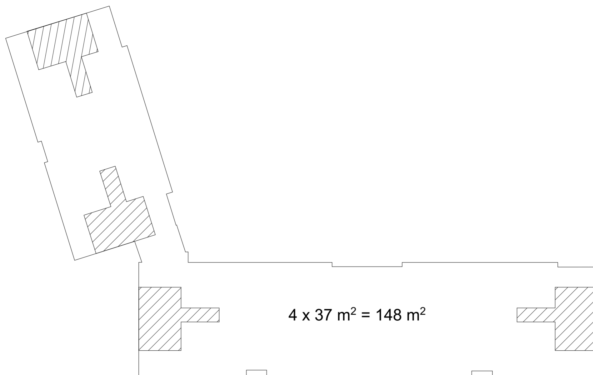
ULLAKKOKERROS / NYKYISET ASUNNOT